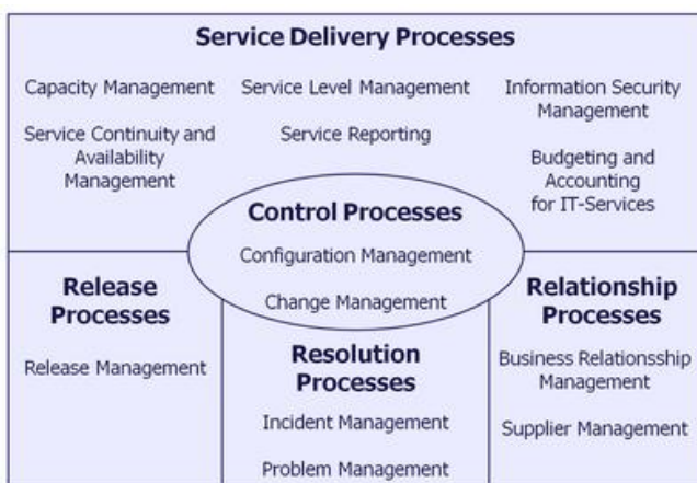
Service-Management nach ISO-20000